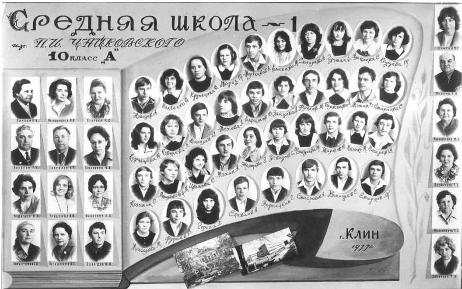
Выпуск 1977г. 10Класс