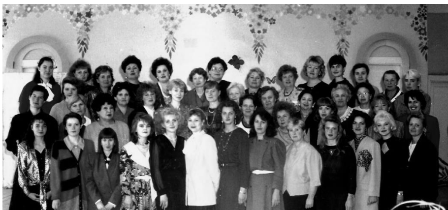
Учителя 1990-е гг.