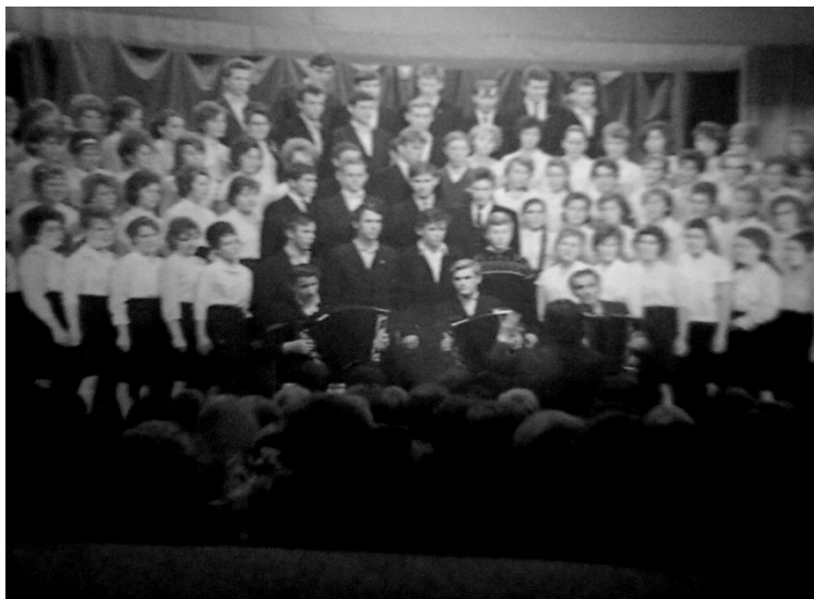
Выступление хора (26 октября 1964г.)