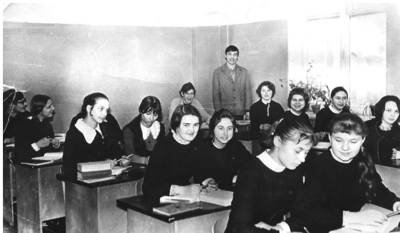
9Б класс. 1974г.