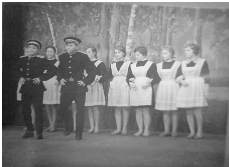
Танцевальный ансамбль. 50-60-е гг.