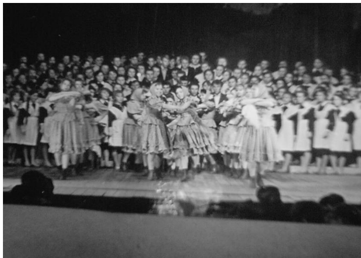
Сводный хор и танцевальный ансамбль школы. 50-60-е гг