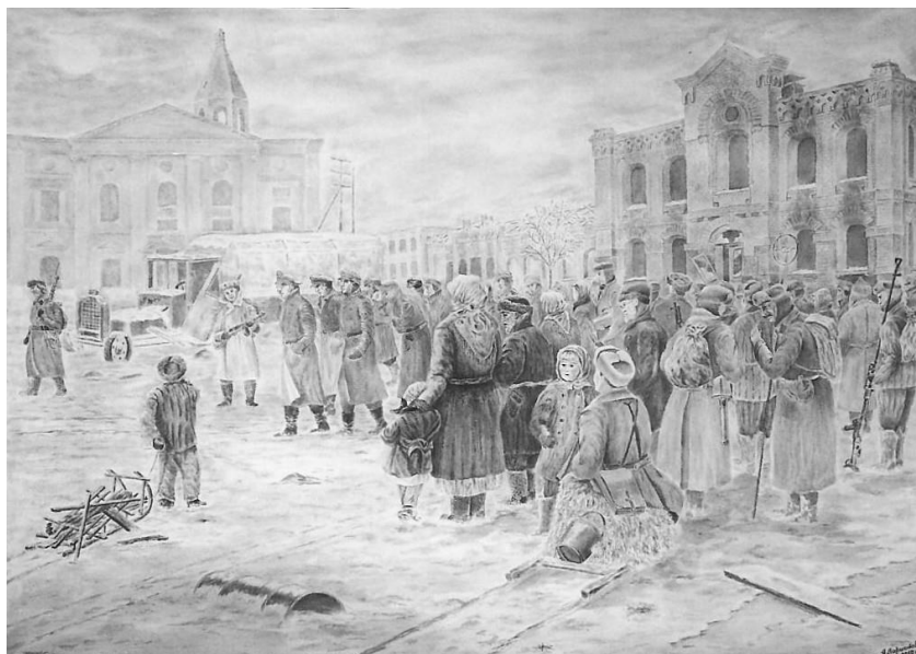
Декабрь 1941г. Пленные немцы. Авторское фото с картины А.Ларионова

Работал с 1950 г. учителем рисования и черчения в школах г. Клина. В школе №4 – в конце 50-х, начале 60-х гг.