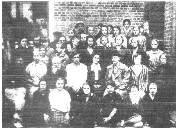
Выпуск 1929г. «Серп и молот» 23.11.1995г