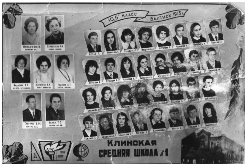
10Б класс. 1975г.