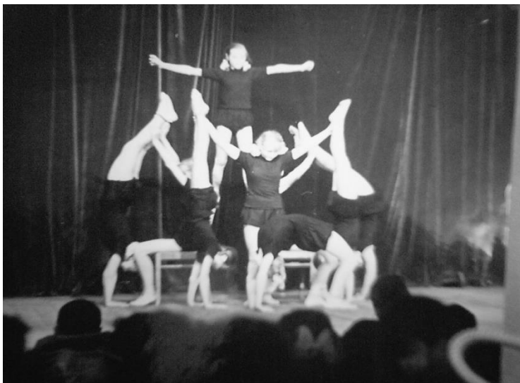
Акробатический этюд . 50-60-е гг