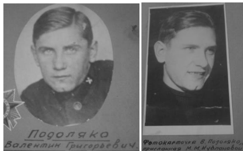
Архивы краеведческого кружка школы №1

Награды: медаль «За отвагу», Орден Красного Знамени, Орден Отечественной войны I степени. (Указы о награждении партизан Украинской ССР)