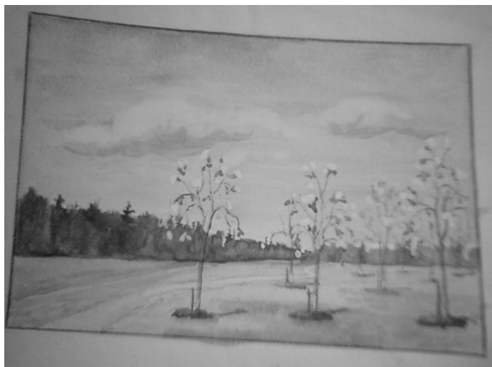
Эскиз декорации А.Ларионова . 1964г.