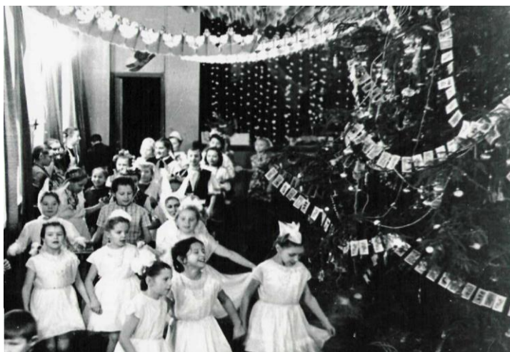
Новый год в новой школе. 1975г