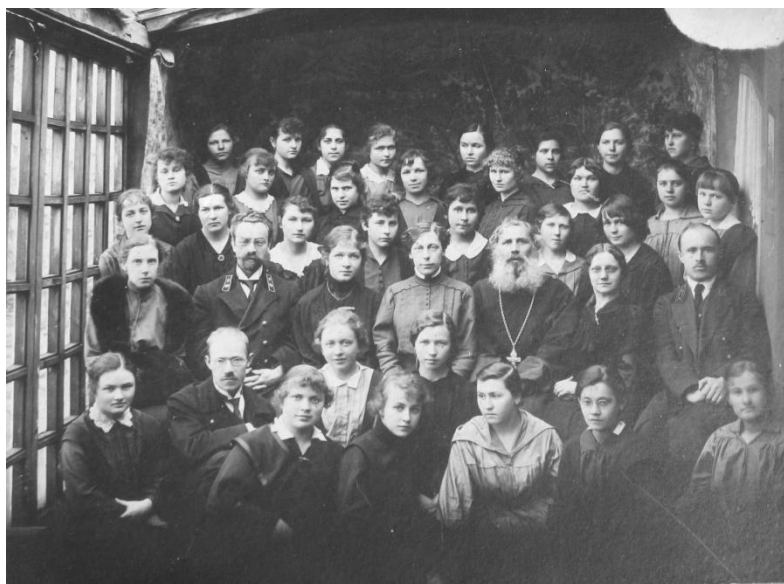
1917г. Выпуск женской гимназии г.Клин.