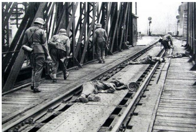
Мост через реку Западный Буг вблизи 12 заставы.

«На участке 12-й заставы, несколько северо-западнее моста,