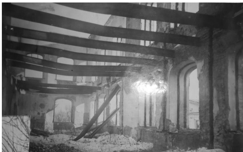
Школа №1 после войны до восстановления