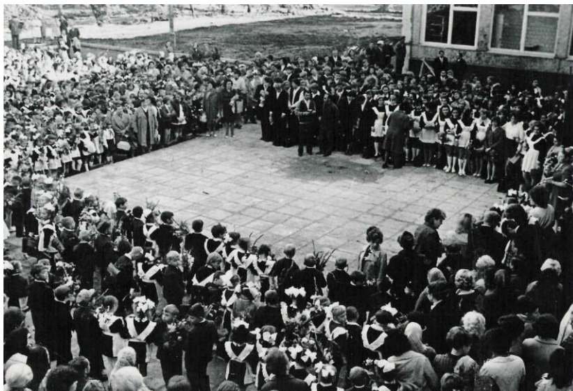
1-е сентября 1975г.