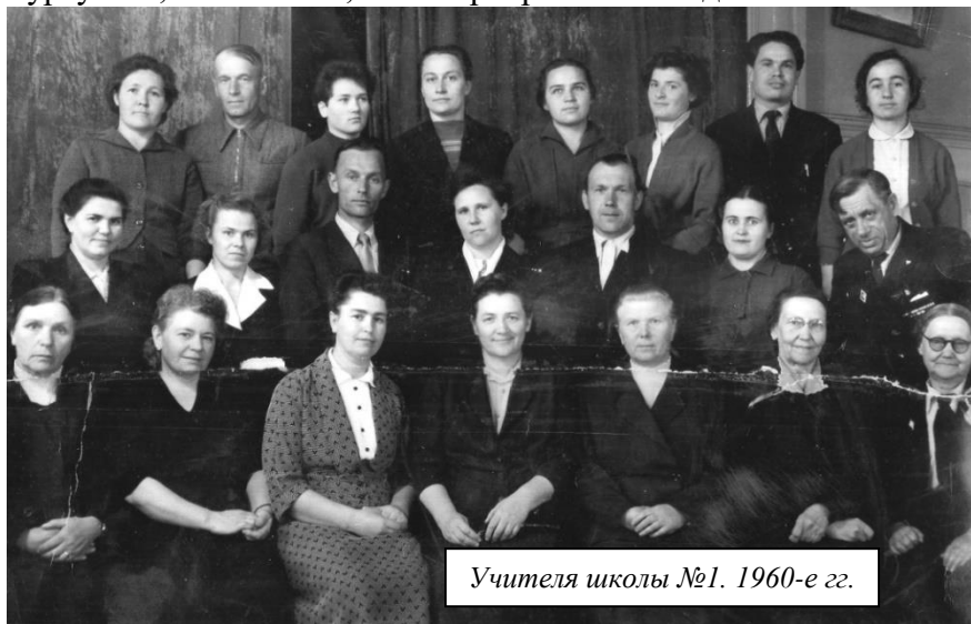
Учителя школы №1. 1960-е гг.