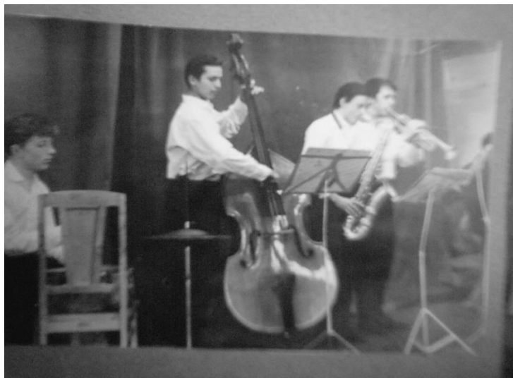
Джазовый ансамбль. 50-60-е гг